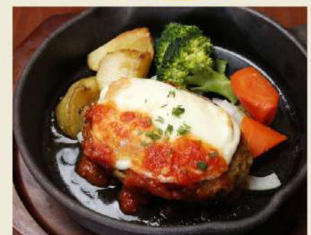
② 糸引きモッツァレラの チリマトソース