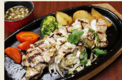
鉄板焼きポークステーキ ディナーセット 1,580円(税込1,738円)