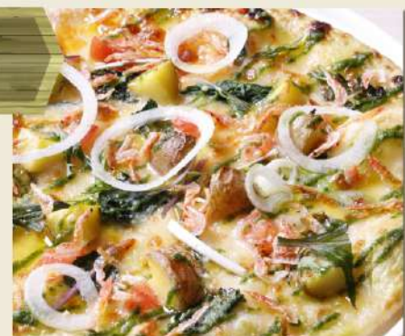
桜海老と旬野菜の ジェノベーゼソース ディナーセット 1,580円(税込1,738円)