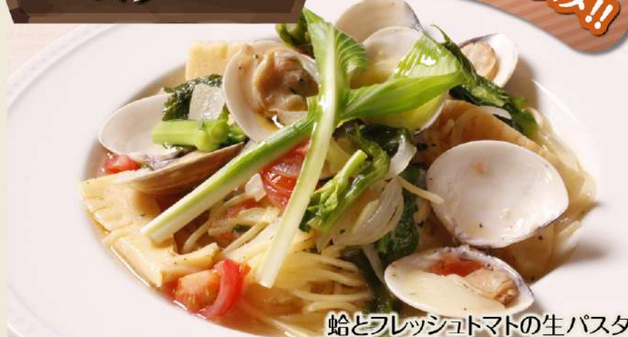
蛤とフレッシュトマトの生パスタ ディナーセット ※パスタはリングイネを使用 1,580円(税込1,738円)