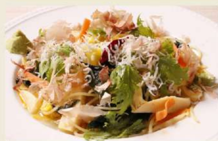
しらすとワカメの 和風ペロンチーノ〜わさび風味〜 生パスタディナーセット 1,480円(税込1,628円)