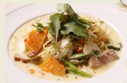
豚肉と地場野菜の ふき味噌クリームソース 生パスタディナーセット 1,480円(税込1,628円)

パスタのソースにつけて食べると Good! ディナーバゲット 140円(税込154円)