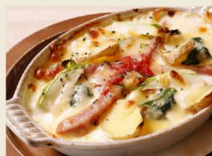
ソーセージと地場野菜の 米粉のクリーミードリア ディナーセット 1,280円(税込1,408円)