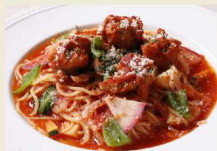
春野菜のトマトソース 生パスタディナーセット 〜スパイス香るチキンフリットのせ〜 1,480円(税込1,628円)