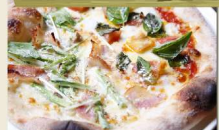
本日のハーフ&ハーフピッツァ ディナーセット 1,480円(税込1,628円)