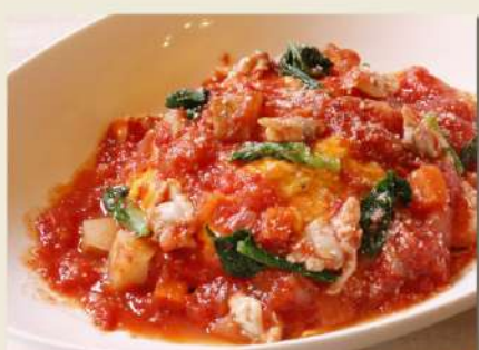
あさりと春野菜のカポナータソースの ふわとろオムライス ディナーセット 1,480円(税込1,628円)