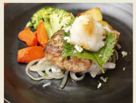
③ 本日の和風ソース