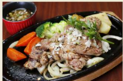
特選牛ステーキ ディナーセット 1,850円(税込2,035円)