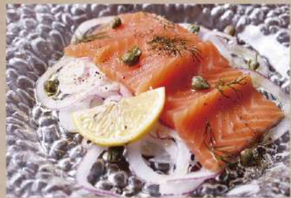
自家製スモークサーモン ~ケッパーとティルの香り~ 580円(税込638円)