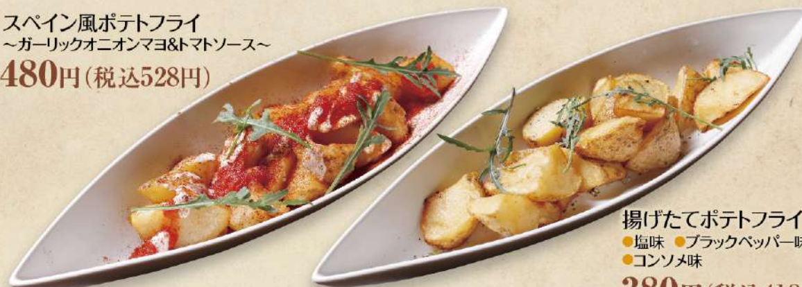
揚げたてポテトフライ ●塩味 ●ブラックペッパー味 ●コンソメ味 380円(税込418円)