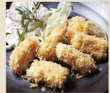
クリームチーズフライ 580円(税込638円)