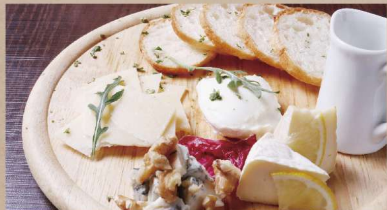
本日のチーズ盛り合わせ ~バゲット付~ 980円(税込1,078円)