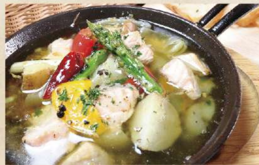
サーモンと旬野菜のアヒージョ 750円(税込825円)