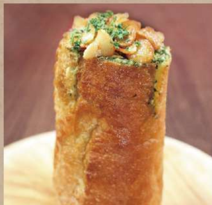
にんにくたっぷり ガーリックトースト 480円(税込528円)