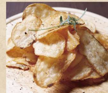
揚げたてポテトチップス ●塩味 ●ブラックペッパー味 ●コンソメ味 380円(税込418円)