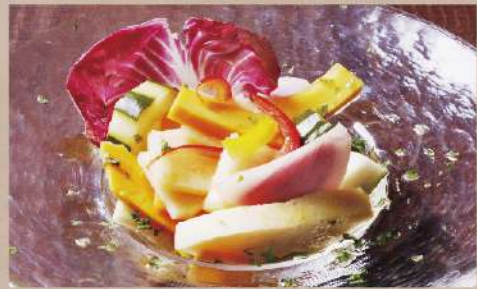
季節野菜の自家製ピクルス 450円(税込495円)