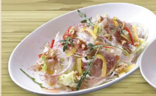
イタリアパルマ産生ハムと くるみのサラダ 880円(税込968円)