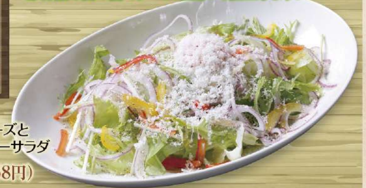
削りたて グラナパダーノチーズと 半熟玉子のシーザーサラダ 780円(税込858円)