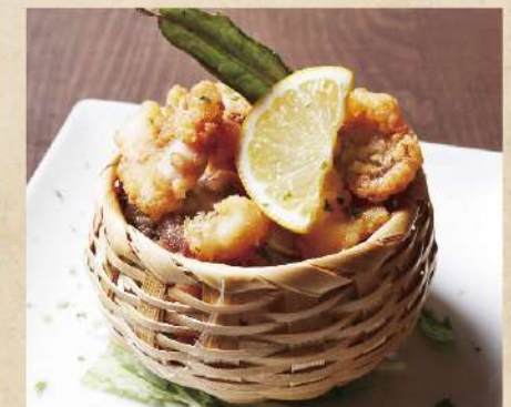
たこ唐揚げ 580円(税込638円)