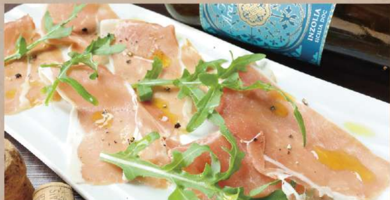
イタリアパルマ産 生ハム 800円(税込880円)