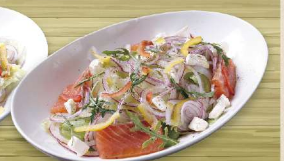
自家製スモークサーモンと クリームチーズのサラダ 980円(税込1,078円)