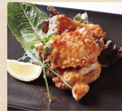
チキンのスパイシー唐揚げ 680円(税込748円)