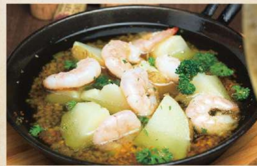
ふりふり海老と旬野菜のアヒージョ 700円(税込770円)